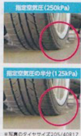
*写真のタイヤサイズ205/40R17