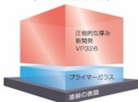
【EXキーパーのメカニズム】

「水シミ」「水アカ」などは、水道水や地下水、泥水などに含まれる無機質の「ミネラル」が、水分が乾く過程でボディに付着し、それが何度も堆積してできます。従来のボディガラスコーティングは、ミネラルと同様に無機質であるため、ミネラルが定着しやすく、水シミや水アカが発生しやすい傾向があります。しかし、EXキーパーの「VP326」被膜は「有機質」の性質を持つため、水シミや水アカの定着を根本的に防ぐことができます。