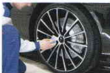
2 アルミホイール4本